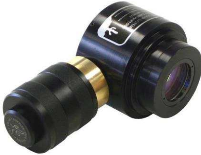
LS100FHa oder DSII