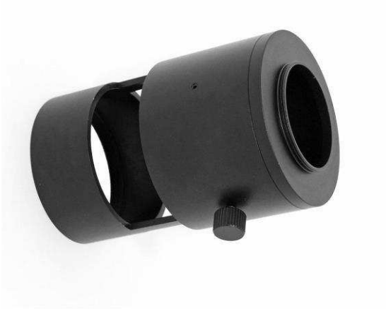
CA – Final