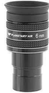
HR Planetary Okulare