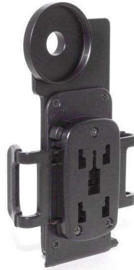
T2 Smartphone Adapter