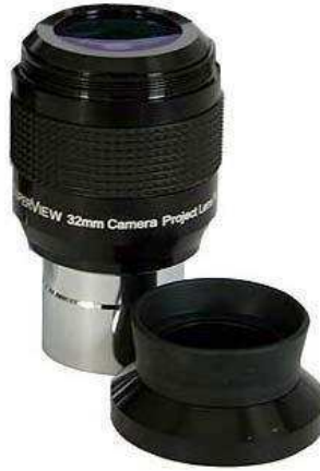
TS SuperView Okulare