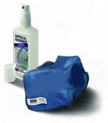
Baader Reinigungsset BA2905009