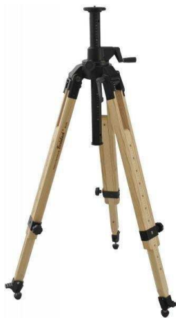
Berlebach Stativ UNI 29C