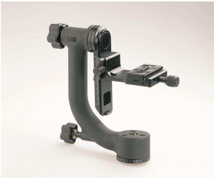
B.I.G. Gimbal Stativkopf für schnelle Schwenks - bis 10 kg Tragkraft