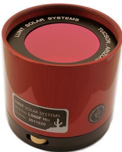
Lunt Double-Stack-Etalon LS60FH \alpha