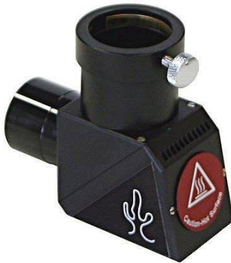
Lunt Solar Systems 1,25"-Herschelprisma LS1SP/HW